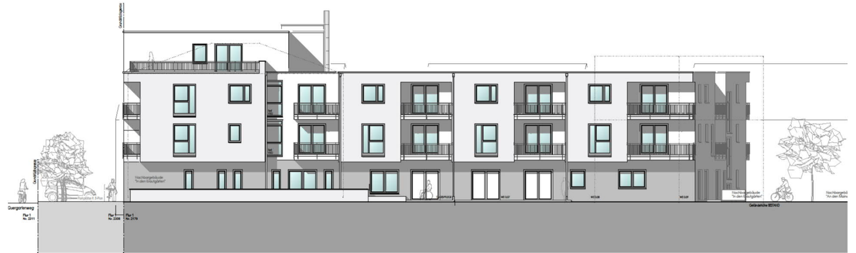
ANSICHT OST -WEG-