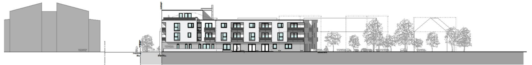
ANSICHT OST -WEG-